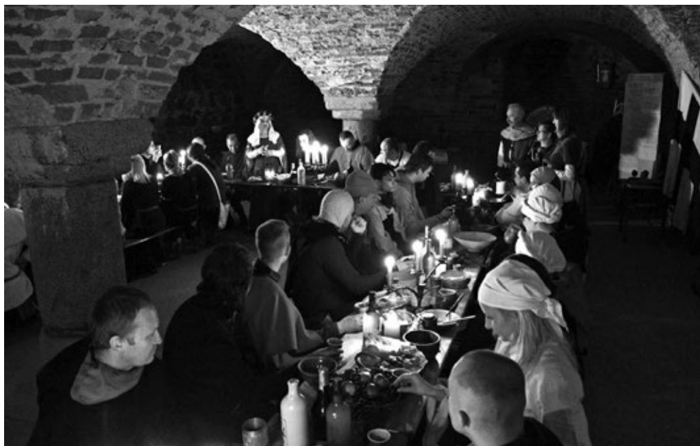
Fot. 12. Uczta rycerska w zamkowych piwnicach

Drugim istotnym elementem działalności bractwa jest organizacja festynów, pikników i jarmarków. Są to wydarzenia nawiązujące do historii i odbywające się wewnątrz zamku. W przeciwieństwie do dużych turniejów na przedzamczu, tutaj istnieje możliwość bardziej indywidualnego podejścia do każdego turysty. Programy przebiegu tych eventów są tak opracowane, że zarówno dzieci jak i dorośli mogą poczuć się jak w wiekach średnich: można przymierzyć zbroję, średnio-wieczny strój, itp.