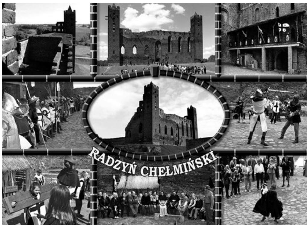
Fot. 33. Przykładowa widokówka zawierająca wizerunek członków bractwa

Bractwo Rycerskie Zamku Radzyńskiego od 5 lat współorganizuje razem ze szkołą w Radzynie Chełmińskim i harcerzami Rajd Śladami Pana Samochodzika i Templariuszy 16 . Współpraca polega na przygotowywaniu zadań dla uczestników rajdu jak i na przeprowadzeniu uatrakcyjniających pokazów 17 . Poza aspektem rycerskim do promocji wykorzystuje się fakt, iż w 1973 roku dwa pierwsze odcinki filmu zostały nagrane na zamku 18 . Jest to film przygodowy, w którym główne role zagraли Ewa Szykulska i Stanisław Mikulski. W 2012 roku, na piątym, jubileuszowym rajdzie, zamek miał zaszczyt ponownie gościć wspomnianych aktorów 19 . W piwnicach zamkowych znajduje się wystawa tematyczna poświęcona temu serialowi.