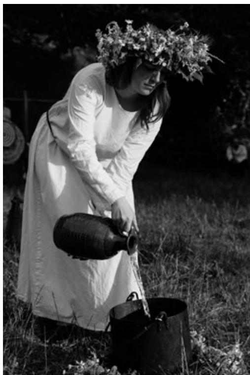
Fot. 24. Przygotowania do wróżb świętojańskich