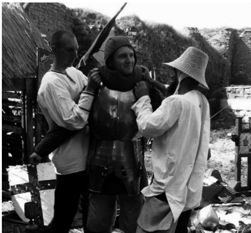
Fot. 14. Przymierzanie zbroi rycerskiej