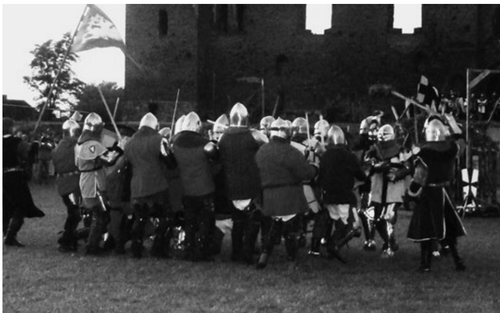
Fot. 10. Punkt kulminacyjny turnieju rycerskiego – inscenizacja historyczna