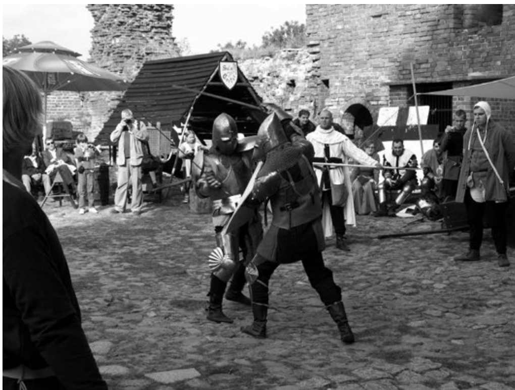
Fot. 18. Pokaz walki rycerskiej

Odtwórcy historii umożliwiają robienie sobie pamiątkowych zdjęć zarówno z najmłodszymi jak i z dorosłymi już turystami. W celu przyciągnięcia większej ilości osób odwiedzających zamek, poza wspomnianym już przymierzaniem zbroi, zapewniany jest szereg innych atrakcji. Wszelakie pokazy walk a także pokazy tańca średniowiecznego połączone z nauką 13 . Przeprowadzane są warsztaty kaligrafii, przez co można poczuć się jak średniowieczny skryba. Od najmłodszych lat można spróbować swoich sił we władaniu mieczem czy zmierzyć się w grze w warcaby, gdzie pionki przedstawiają dwa oddziały zbrojne, które spotkały się na polach grunwaldzkich. Poza tym można nauczyć się strzelać z łuku czy wyrabiać średniowieczną cegłę z gliny 14 .