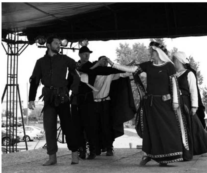
Fot. 19. Pokaz tańca średniowiecznego