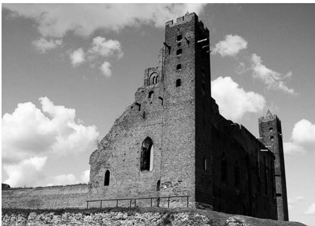
Fot. 1. Widok zamku od zachodu

ZAMEK w Radzynie Chełmińskim jest interesującym obiektem architektury średniowiecznej. Stanowi wzorcowy przykład krzyżackiej budowli obronnej. Wybudowany na przełomie XIII i XIV wieku 1 , zaliczany jest do jednych z największych krzyżackich budowli tego typu na terenie kraju. Zamek wzniesiono na planie prawie idealnego kwadratu o bokach 52,8 x 52,1 metra 2 . Usytuowany został na wzniesieniu między dwoma jeziorami, które obecnie są wyschnięte 3 .