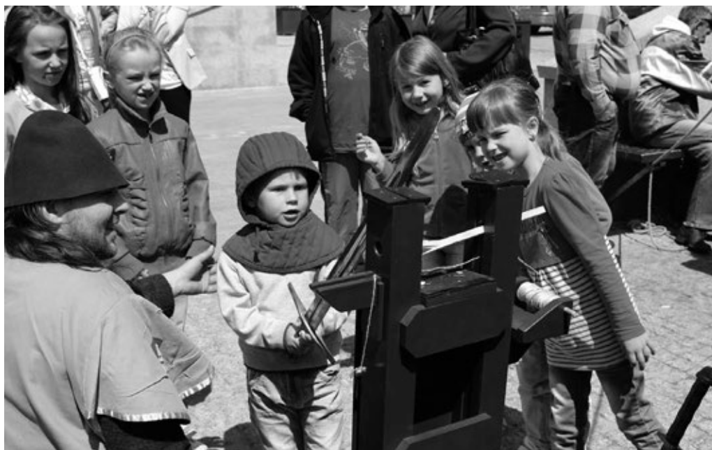
Fot. 17. Rycerskie zabawy