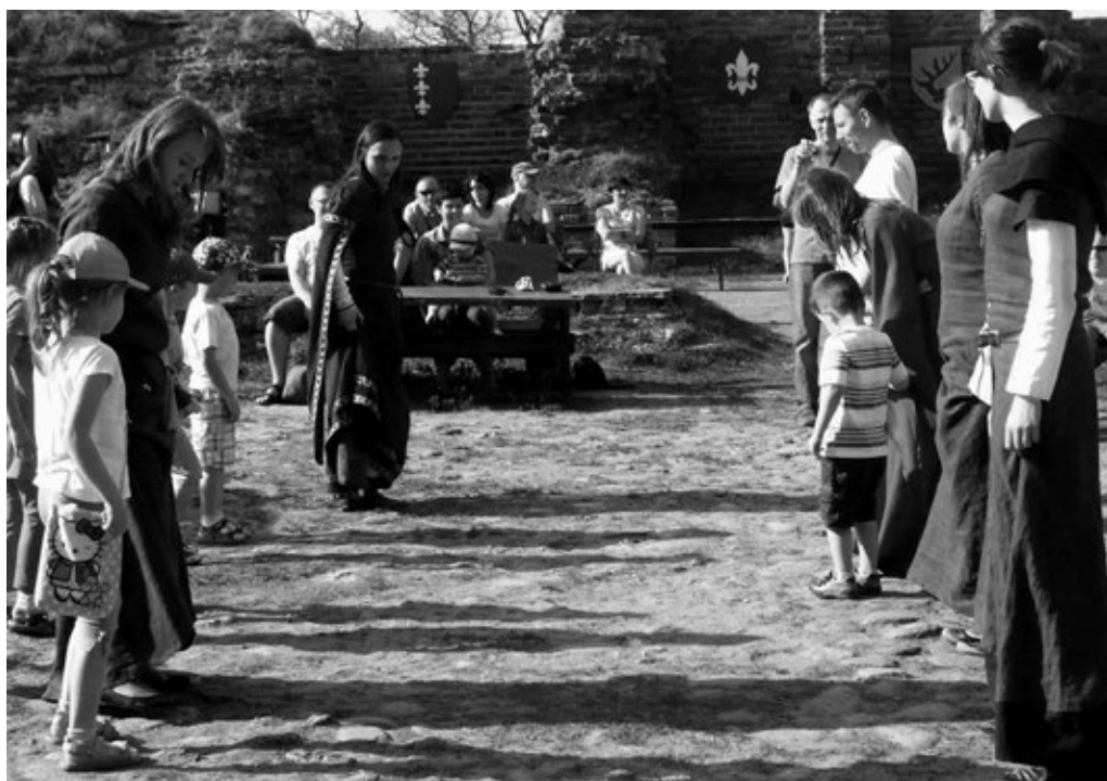
Fot. 20. Nauka tańca średniowiecznego