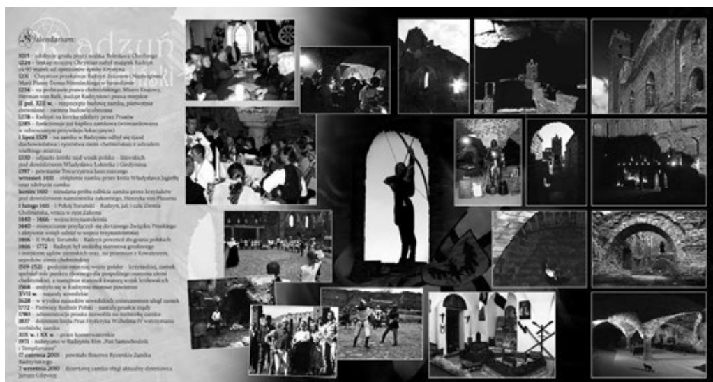
Fot. 32. Przykładowy folder reklamujący zamek w Radzynie

W związku z tym, że grupa rekonstrukcji historycznej działająca w Radzynie Chełmińskim odgrywa tak istotną rolę w promocji zamku, postanowiono wykorzystać wizerunek bractwa w materiałach promocyjnych. Poza umieszczaniem zdjęć stowarzyszenia na stronach internetowych reklamujących zamek 15 , znalazły się one również na pamiątkowych widokówkach, folderach i naklejkach.