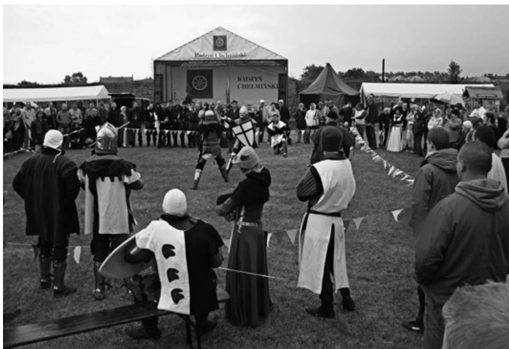
Fot. 8. Turniej bojowy