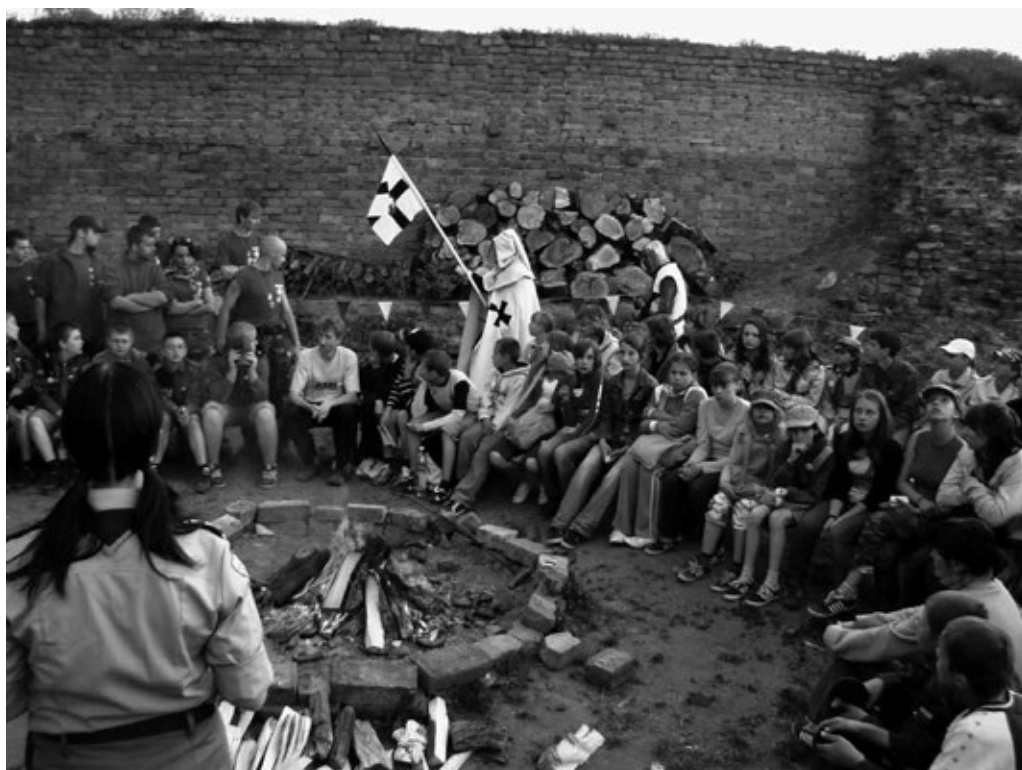
Fot. 37. Harcerskie ognisko