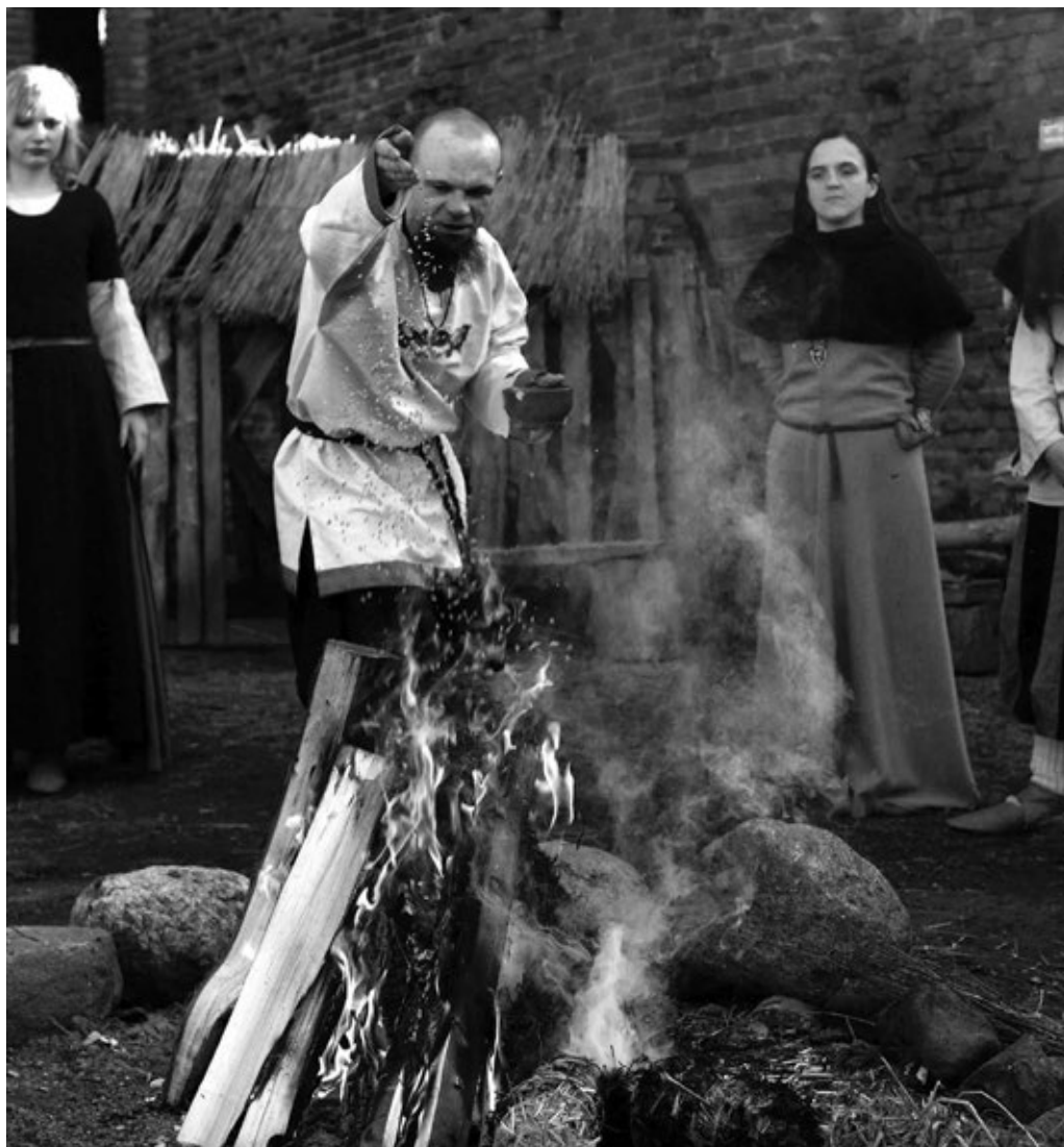
Fot. 26. Składanie darów w ogień podczas jarych godów

Zamek w Radzynie Chełmińskim posiada rozbudowaną ofertę tematyczną z zakresu historii przeznaczoną dla szkół. Dziecko, które spędziło czas na poznawaniu historii w ciekawszy sposób wewnątrz zamku wraca po pewnym czasie ponownie do niego już z całą swoją rodziną. Ogromne znaczenie w organizowaniu tego typu wycieczek ma indywidualne podejście i autentyczność. Młodzi ludzie przyjeżdżający do Radzyna, od samego początku wycieczki przenoszą się w odległe czasy średniowiecza. Wsłuchują się w słowa przewodnika przybliżającego im dzieje zamku a także mają możliwość w namacalny sposób przekonać się, czym zajmował się człowiek żyjący 600 lat temu.