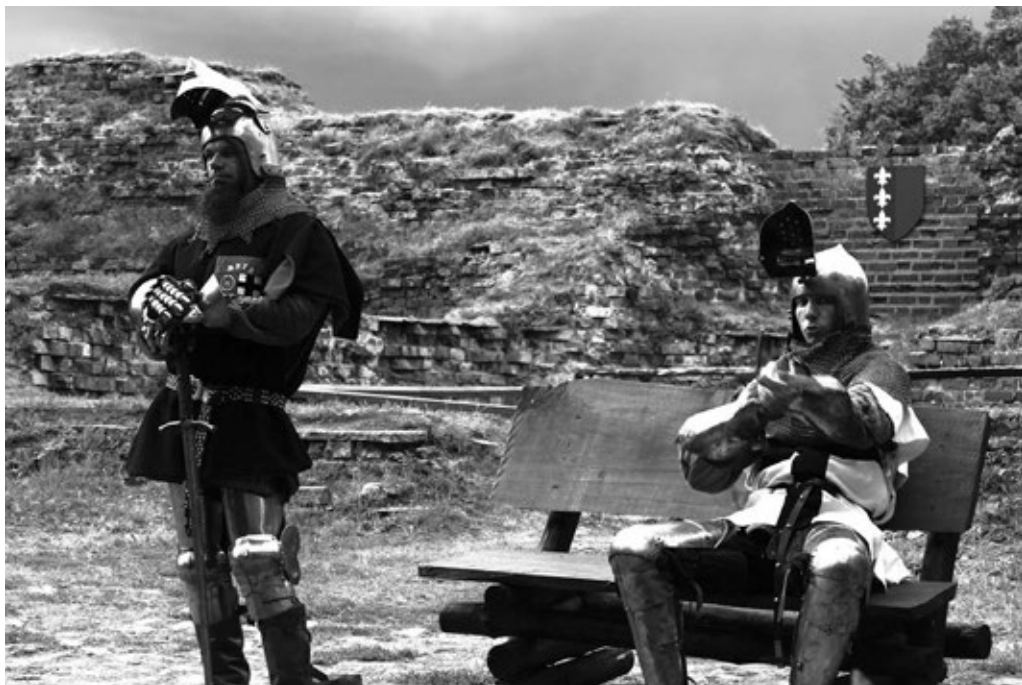
Fot. 6. Dwóch zbrojnych rycerzy Bractwa