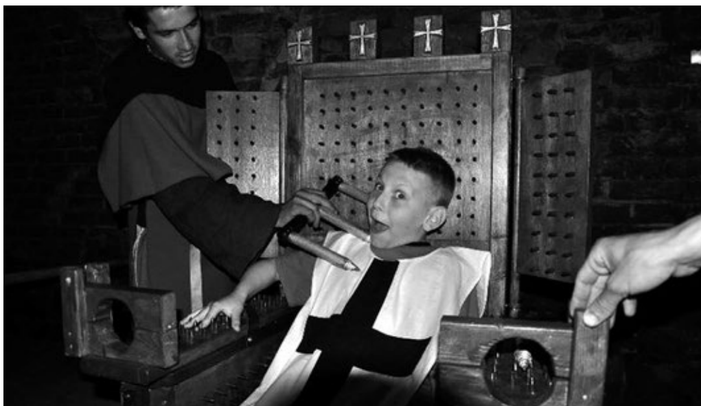
Fot. 30. Zajęcia dla szkół – zwiedzanie sali tortur

Jedna z sal zamkowych, w której niegdyś znajdował się mechanizm do podnoszenia brony bramnej, stanowi obecnie siedzibę bractwa. Członkowie stowarzyszenia własnymi siłami i środkami finansowymi dokonali w niej remontu czyniąc z niej mini-muzeum, idealne miejsce do przeprowadzania żywych lekcji historii.