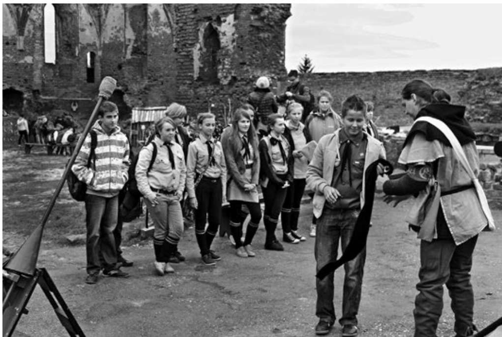
Fot. 34. Zadania do zrealizowania przez uczestników rajdu, przygotowane przez bractwo rycerskie