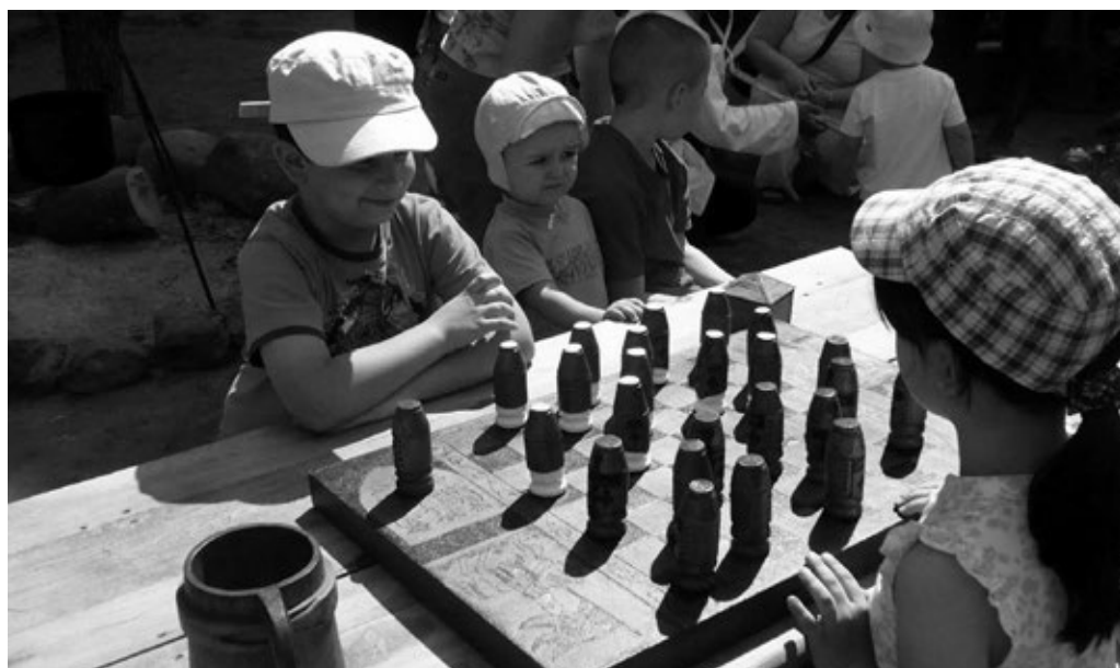
Fot. 22. Gra w warcaby