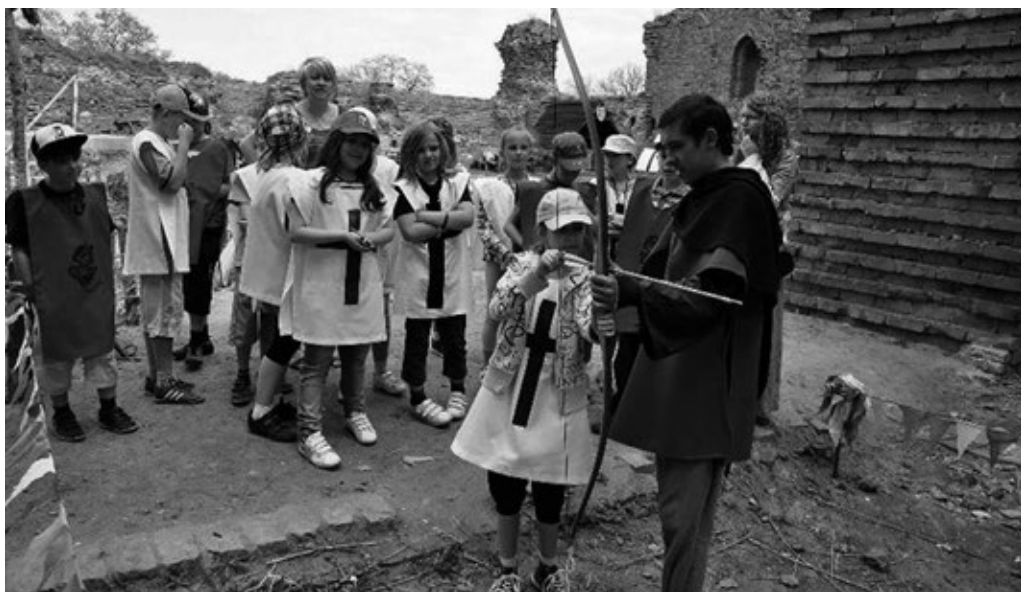
Fot. 29. Zajęcia dla szkół – nauka strzelania z łuku