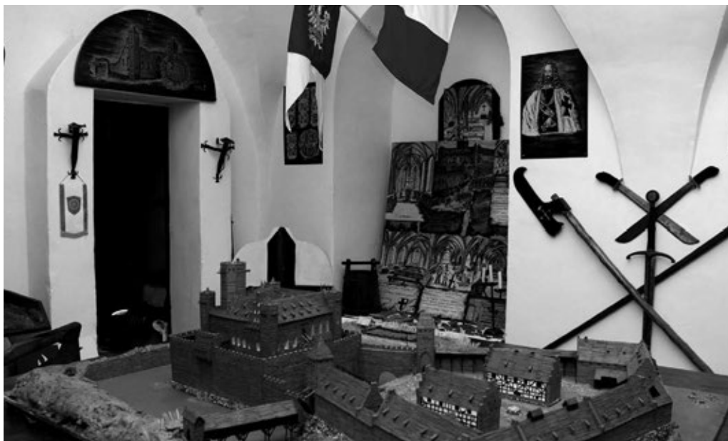
Fot. 31. Siedziba Bractwa Rycerskiego Zamku Radzyńskiego

W związku z tym, że grupa rekonstrukcji historycznej działająca w Radzynie Chełmińskim odgrywa tak istotną rolę w promocji zamku, postanowiono wykorzystać wizerunek bractwa w materiałach promocyjnych. Poza umieszczaniem zdjęć stowarzyszenia na stronach internetowych reklamujących zamek 15 , znalazły się one również na pamiątkowych widokówkach, folderach i naklejkach.