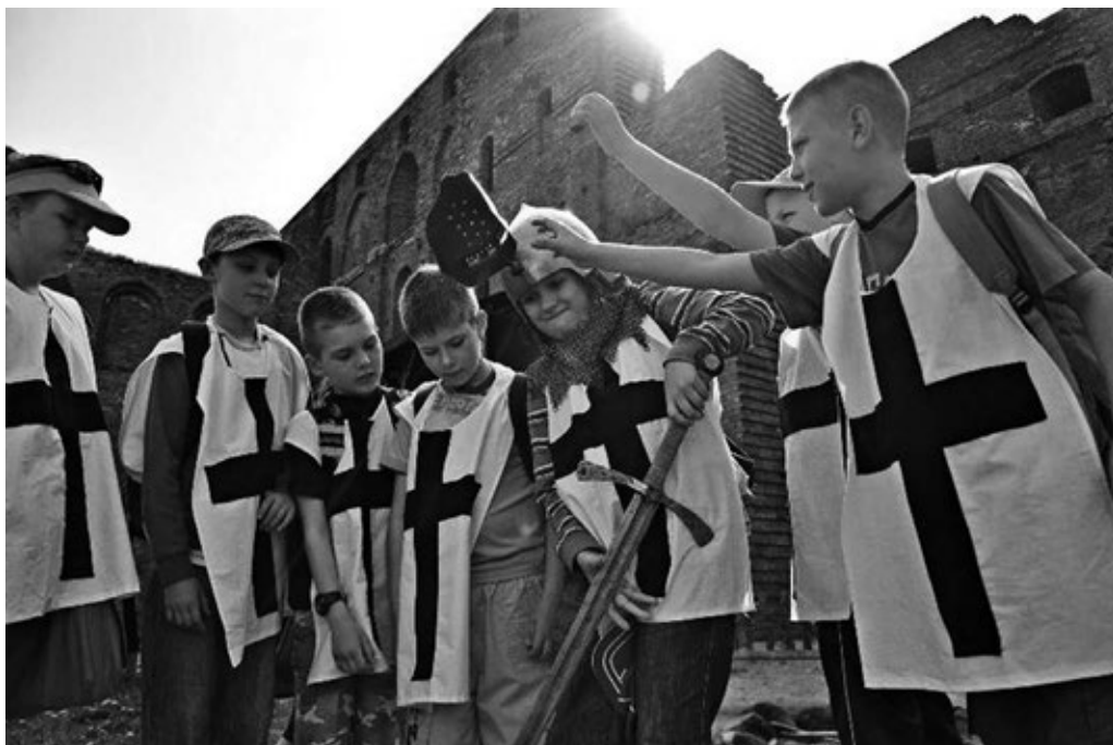
Fot. 27. Zajęcia dla szkół