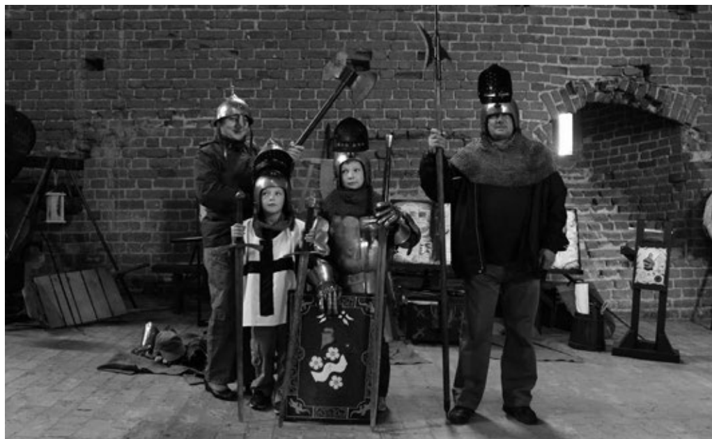
Fot. 15. Przymierzanie uzbrojenia rycerskiego