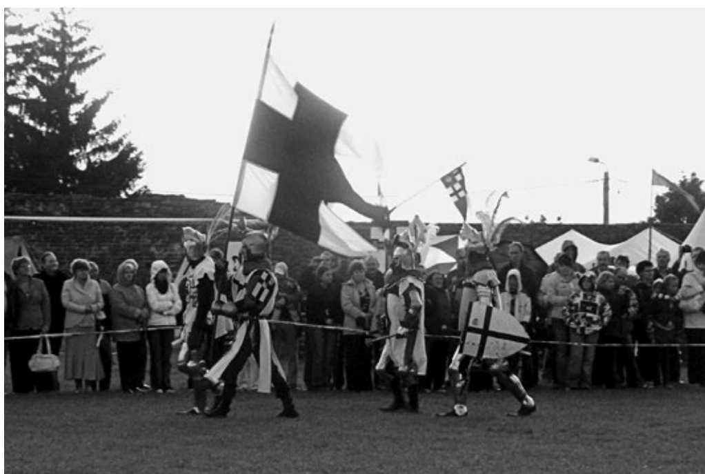
Fot. 9. Punkt kulminacyjny turnieju rycerskiego – inscenizacja historyczna