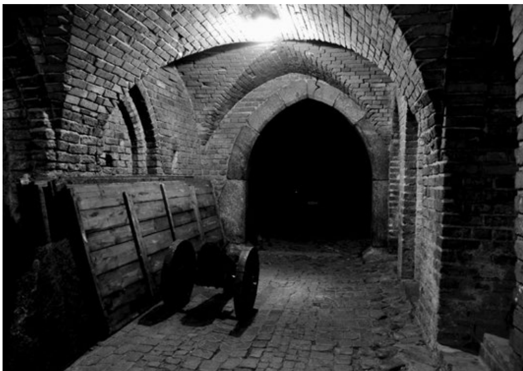
Fot. 4. Szyja bramna