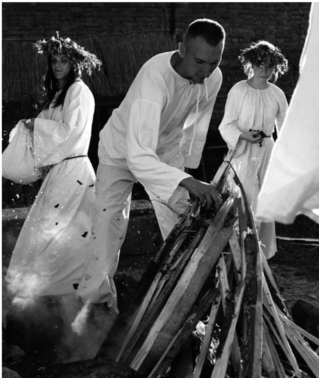
Fot. 23. Rozpalanie ogniska świętojańskiego

Niebagatelne znaczenie w promocji zamku odgrywają organizowane inscenizacje tematyczne. Poza dużymi turniejami i mniejszymi festynami, przygotowywane są również w murach warowni w Radzynie Chełmińskim typowe inscenizacje tematyczne. Najczęściej związane z dawnymi czasem zapomnianymi już, obrzędami takimi jak Jare Gody (dzisiejszy Pierwszy Dzień Wiosny) czy Noc Kupały (dzisiejsza Noc świętojańska). Członkowie stowarzyszenia inicjują odpowiednie ceremonie z oprawą i opisem historycznym, na które przybywają licznie turyści.