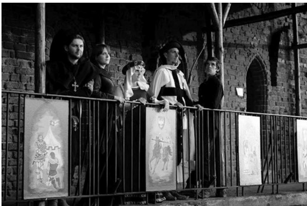
Fot. 7. Przedstawiciele Bractwa Rycerskiego Zamku Radzyńskiego