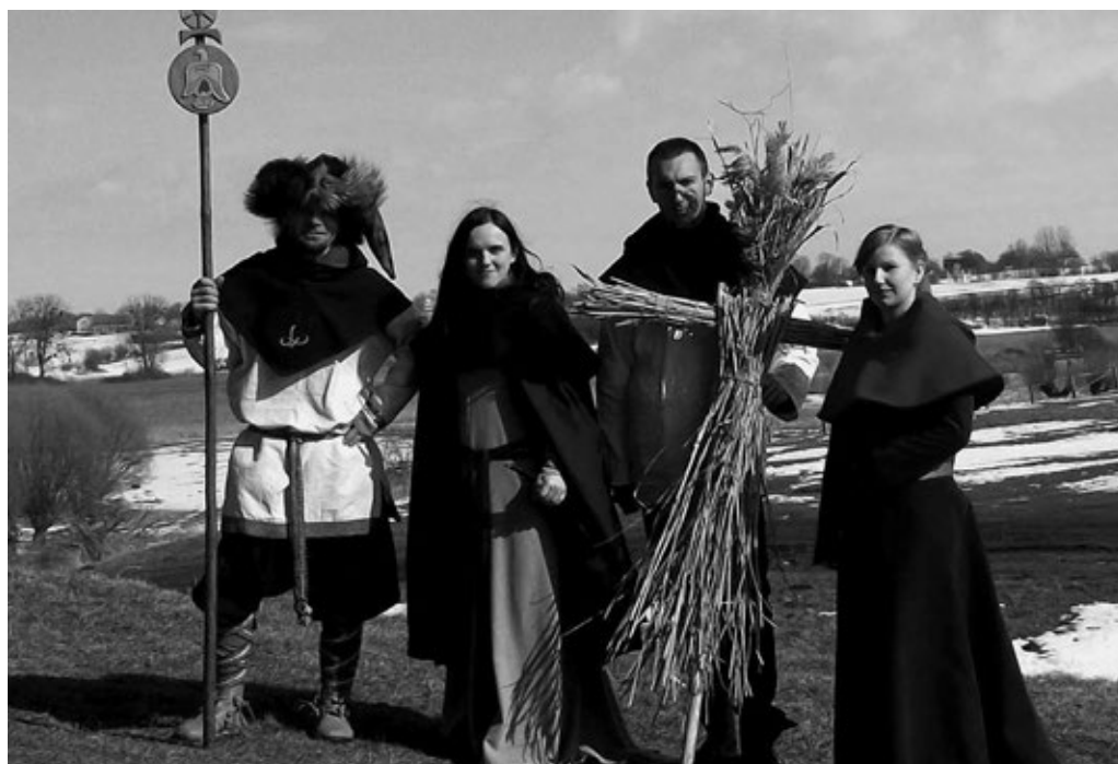
Fot. 25. Jare Gody