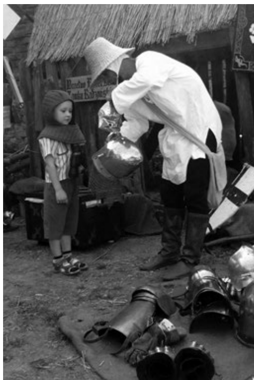
Fot. 13. Przymierzanie helmu rycerskiego

Drugim istotnym elementem działalności bractwa jest organizacja festynów, pikników i jarmarków. Są to wydarzenia nawiązujące do historii i odbywające się wewnątrz zamku. W przeciwieństwie do dużych turniejów na przedzamczu, tutaj istnieje możliwość bardziej indywidualnego podejścia do każdego turysty. Programy przebiegu tych eventów są tak opracowane, że zarówno dzieci jak i dorośli mogą poczuć się jak w wiekach średnich: można przymierzyć zbroję, średnio-wieczny strój, itp.