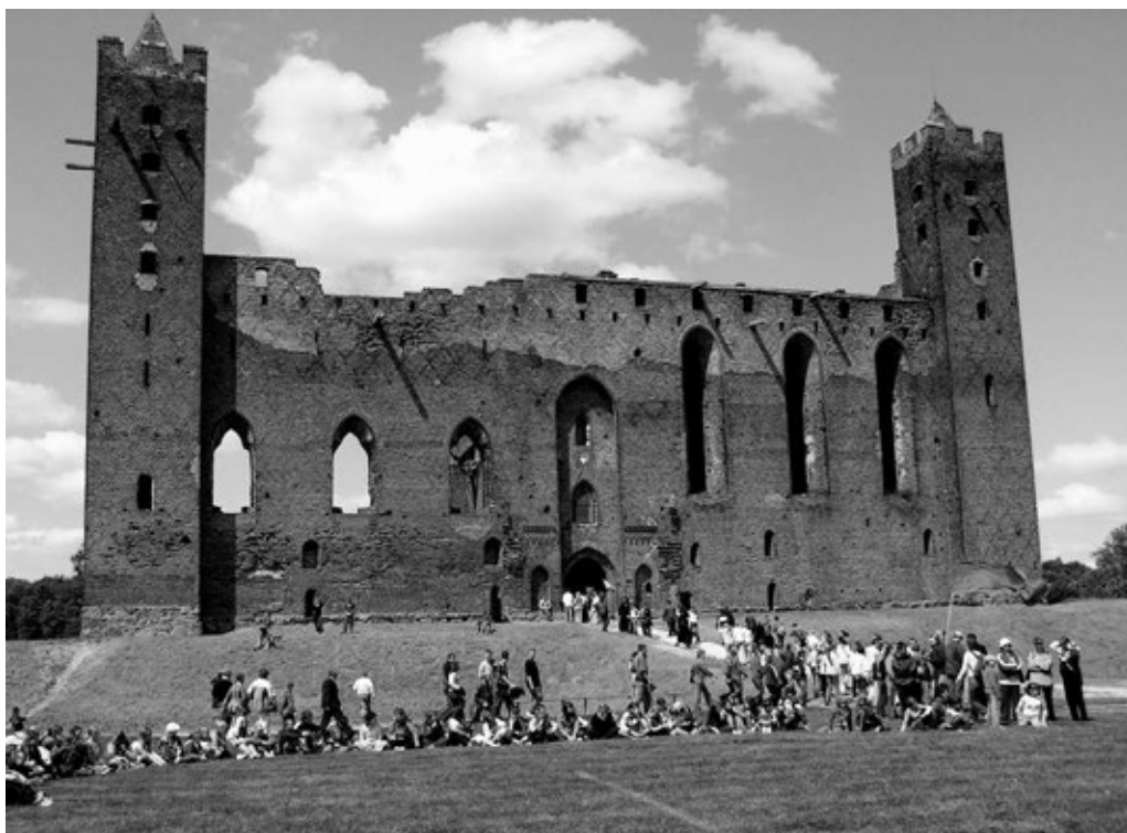
Fot. 3. Północne skrzydło zamku

Mimo tego do dnia dzisiejszego warownia zachwyca swym wyglądem. Na pierwszy rzut oka widoczne są dla turysty wysokie ściany skrzydła południowego zamku z dwiema narożnymi wieżami. Kiedy jednak turysta przekracza oryginalny XIV-wieczny, granitowy portal i wkracza do szyi bramnej, odsłaniają się przed nim mniejsze i większe sale zamkowe oraz wszelkie perełki architektoniczne. Zamek posiada niepowtarzalny klimat o każdej porze dnia i roku.