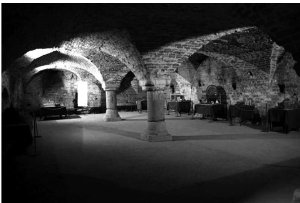
Fot. 5. Piwnica zamkowa