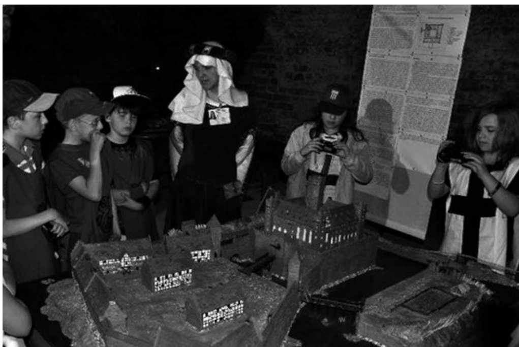
Fot. 28. Zajęcia dla szkół – zapoznanie z historią i architekturą średniowiecznych budowli obronnych