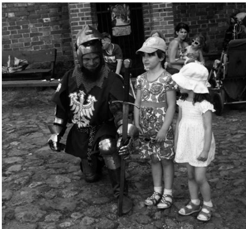
Fot. 16. Indywidualne podejście odtwórców historycznych