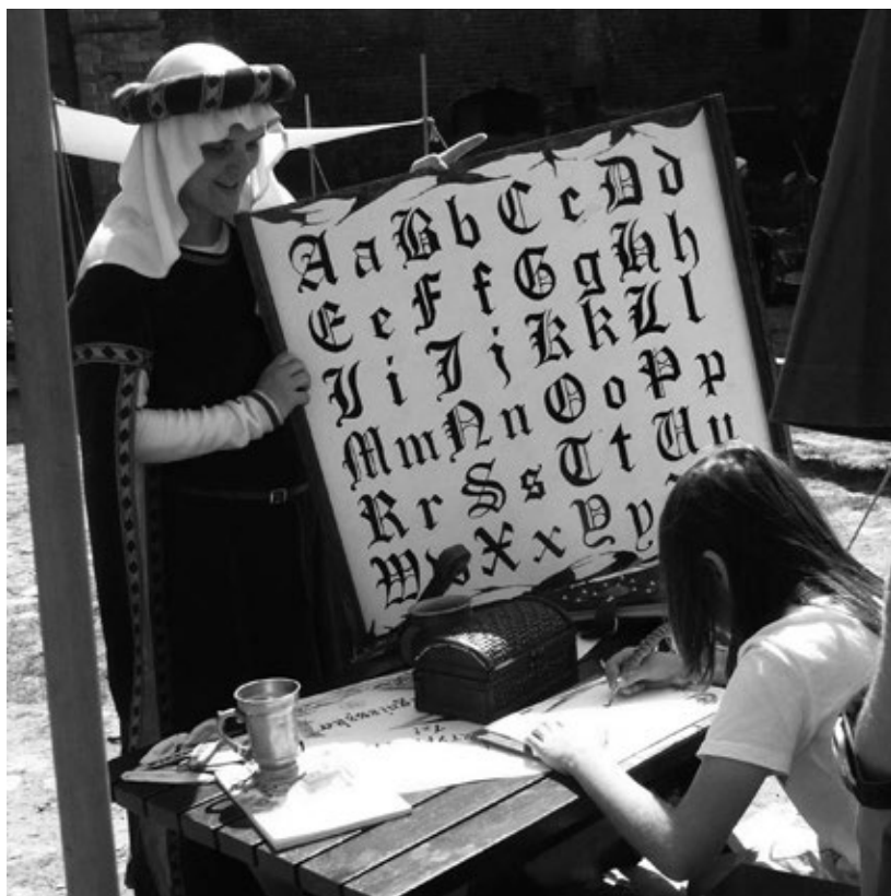
Fot. 21. Warsztaty kaligrafii